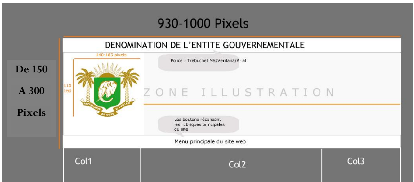
ILLUSTRATION ENTETE DES SITES GOUVERNEMENTAUX